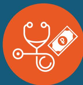
Оплата диагностических процедур