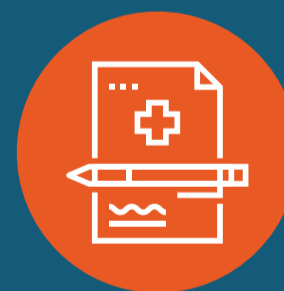
Выписка справок, направлений